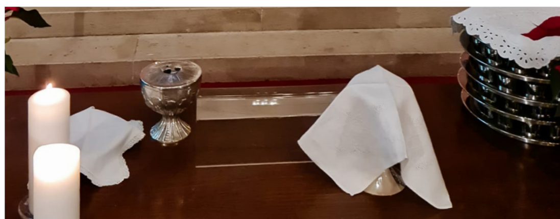
↑ Vorbereiteter Gabentisch für die Abendmahlsfeier Links: Kelch mit den Broten, rechts: kleine Becher für das Blut Christi